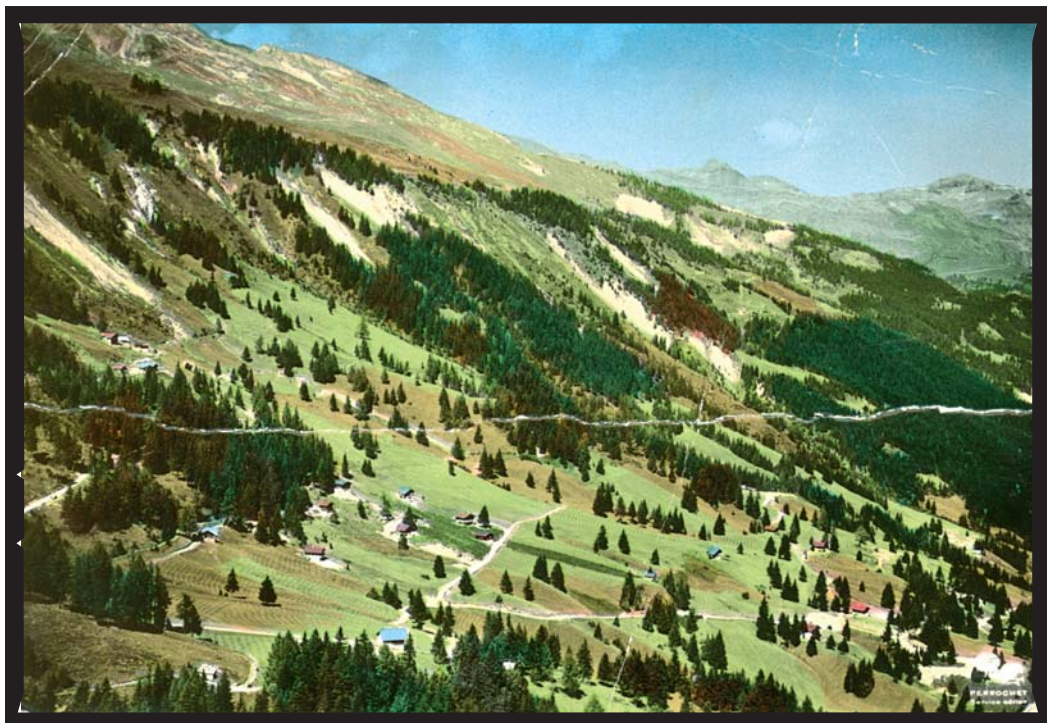
Anzère à la fin des années 50 - une prise de vue colorisée.

Anzère était orthographié autrefois "Antsère"; ce mot tiré du patois "Intière" signifie entier; expression donnée aux pâturages d'Anzère qui, avant le remaniement parcellaire de 1933 comptent, 2768 parcelles et 350 propriétaires. Pour éviter les dommages au fond voisin, cette zone est mise à ban et fauchée chaque année à date fixe, le 23 août, jour de la St. Barthélémy.